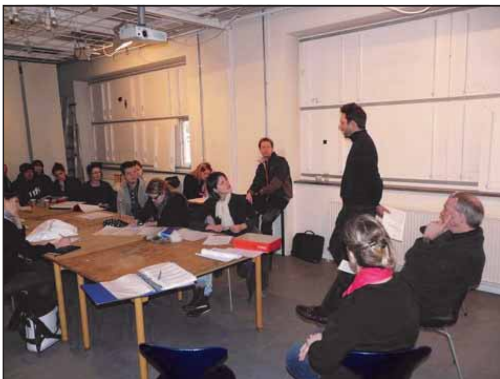
Danmarks Designskole d. 27 januar 2010

Nærmere oplysninger får hos oldermand Leif Helbro Olsen mobil. 40 45 05 41