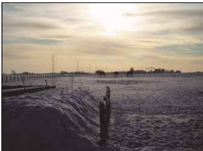
Stemningsbilleder i denne hvide tid